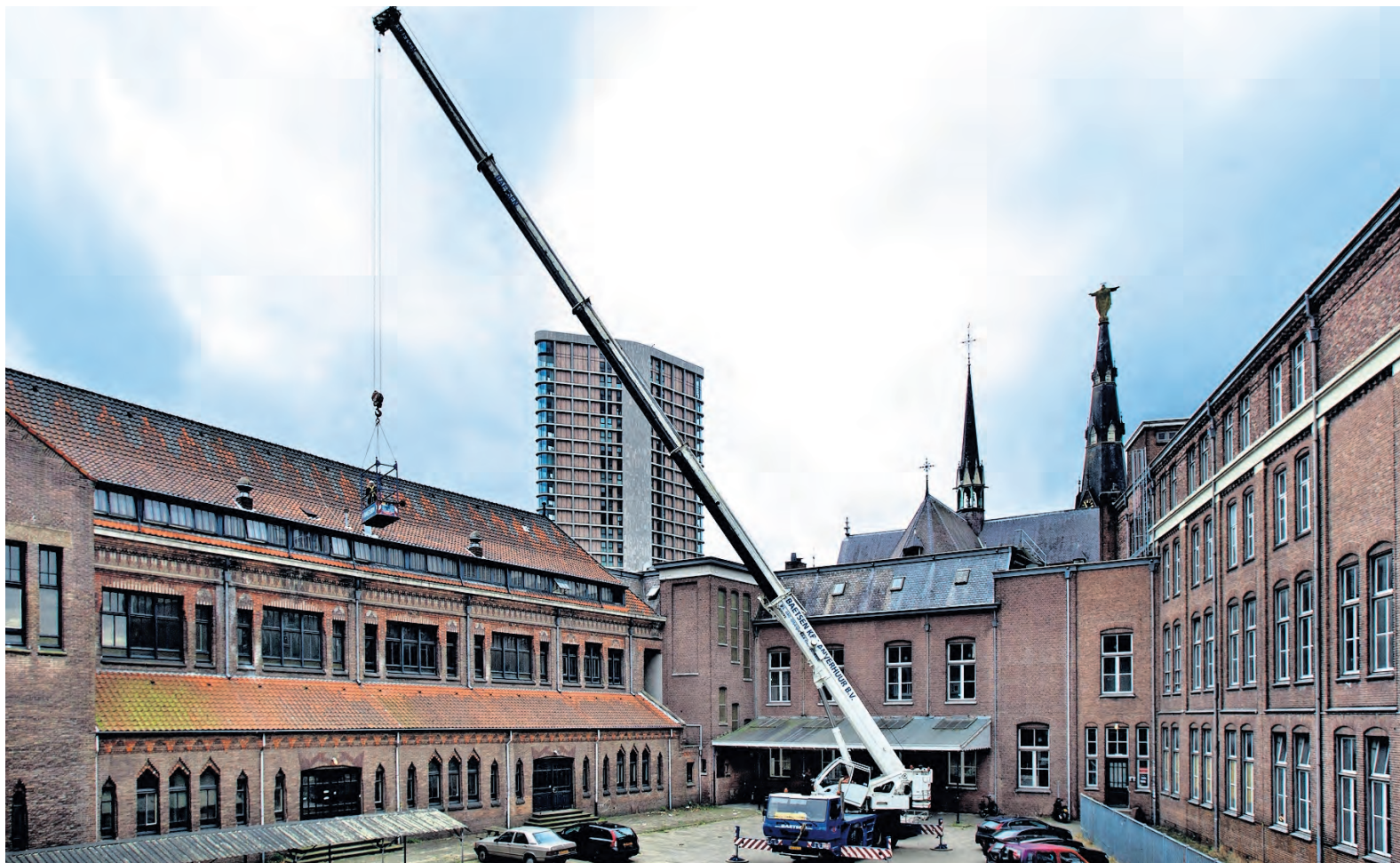
▲ Medewerkers van Vitruvius zijn gisteren begonnen met het in kaart brengen van alle bouwkundige details van de Paterskerk, de Kapel en de omliggende gebouwen. De mannen in het bakje aan de hoogwerker fotograferen het dak.