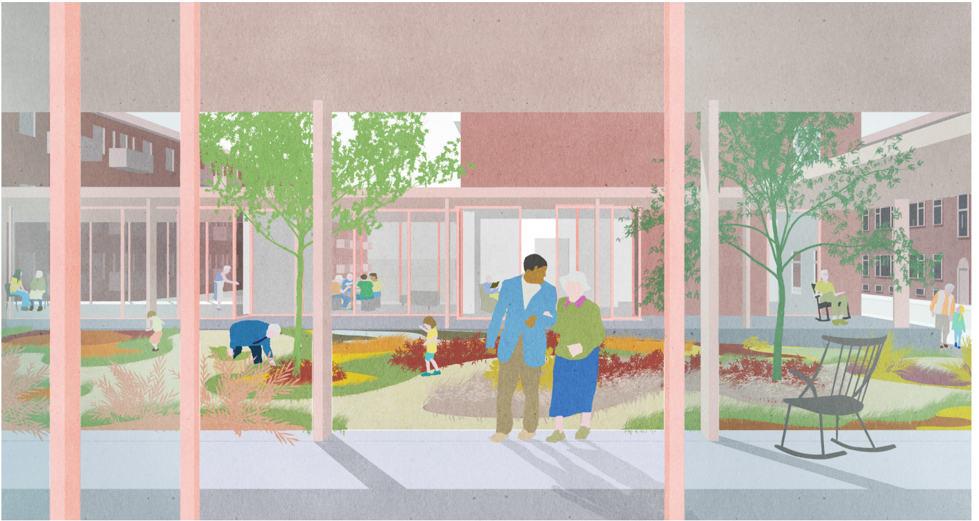
Buurtbewoners worden elkaars netwerk, en er ontstaat weer een dialoog tussen de openbare ruimte en de bebouwing